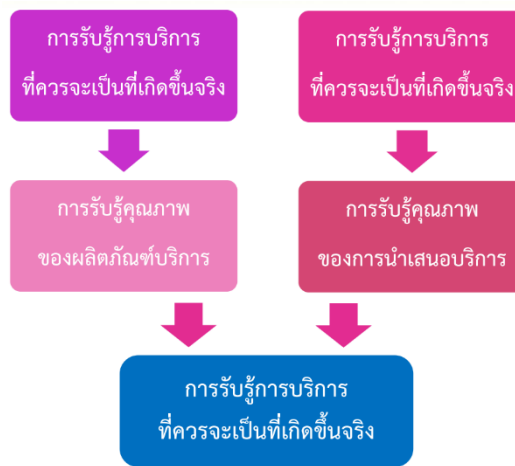
ภาพที่ 2-1 : องค์ประกอบของความพึงพอใจในการบริการ

เข้าถึงบริการ พฤติกรรมการแสดงออกของผู้ให้บริการตามบทบาทหน้าที่และปฏิริยาการตอบสนองการบริการของผู้ให้บริการต่อผู้รับบริการ ในด้านความรับผิดชอบต่องานการใช้ภาษาสื่อความหมายและการปฏิบัติตนในการให้บริการ จะเห็นว่าความพึงพอใจในการบริการเกิดจากการประเมินคุณค่าการรับรู้คุณภาพของการบริการเกี่ยวกับผลิตภัณฑ์บริการตามลักษณะของการบริการ และกระบวนการนำเสนอบริการในวงจรของการให้บริการระหว่างผู้ให้บริการและผู้รับบริการซึ่งถ้าตรงกับสิ่งที่ผู้รับบริการมีความต้องการหรือตรงกับความคาดหวังที่มีอยู่ หรือประสบการณ์ที่เคยได้รับบริการตามองค์ประกอบดังกล่าวข้างต้น ก็ย่อมจะนำมาซึ่งความพึงพอใจในบริการนั้น แต่หากเป็นไปในทางตรงกันข้ามสิ่งที่ผู้รับบริการได้รับจริงไม่ตรงกับการรับรู้ที่คาดหวัง ผู้รับบริการย่อมเกิดความไม่พึงพอใจต่อผลิตภัณฑ์และการนำเสนอบริการได้ จึงสามารถแสดงเป็นภาพองค์ประกอบของความพึงพอใจในการบริการได้ ดังภาพที่ 2-1